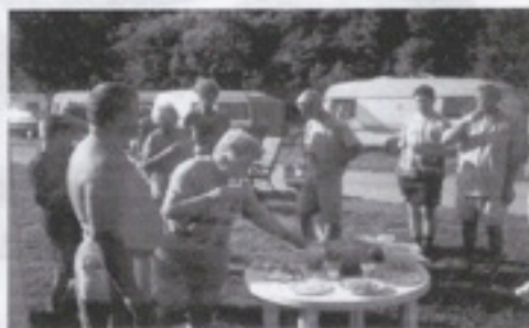
Aperitief in de namiddag