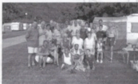
Groepsfoto te Houyet (op 2 personen na) tijdens het weekend van 17 augustus 2001

Bij onze aankomst waren er reeds deelnemers uit Nederland. Het is altijd fijn om elkaar terug te zien, te meer daar we zelf niet veel meer op bijeenkomsten kwamen. Vanaf vrijdag mochten we andere mensen begroeten en in het weekend waren we met 19 caravans en 1 tent. Het was onze bedoeling om zo kalm mogelijk onze dagen te slijten. Vakantie nemen in een prachtige omgeving waar altijd iets te zien is.