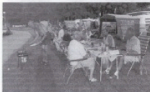
Tijdens de Barbecue van 18 augustus 2001

Een plaatselijke timmerman en zijn zoon, verzamelden in 15 jaar al wat ze konden vinden over wielerkampioenen: Bartali, Kubler, Merckx, Monseré en noem maar op. Deze renners schonken trofee's, kranten, medailles en bekers. Onze Merckx gaf zelfs een fiets. Het was heerlijk om nog eens al die oude vertrouwde mensen op foto te zien en we interesseerden ons allemaal in onze eigen kampioenen.