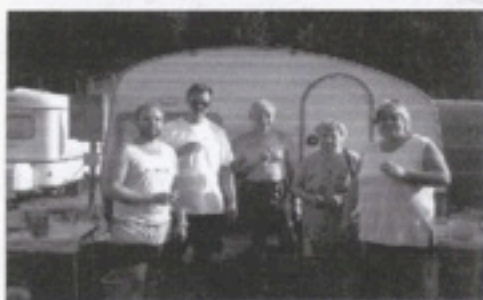
Onze Duitse gasten

zal prospectie doen in het Waalse landsgedeelte om zo onze Franstalige kampeersers aan te trekken.