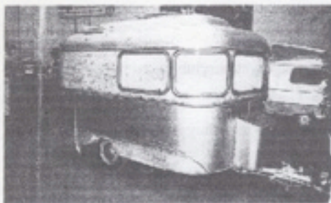
De fabrikant van de Nagetusch Brillant 3 heeft voor zijn 4,05 m lange caravan uit 1964 waarschijnlijk even gekeken hoe een Constructam er toen uitzag.