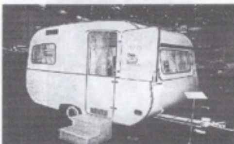
In 1965 werd de Kiel van Woltbümmler gefabriceerd. Hij is 3,10 x 1,85 m groot en weegt 600 kg. De ramen met houten kader waren de eerste die geen koude bruggen hadden. De Woltbümmlers waren waarschijnlijk de eerste caravans met een polyester buitenlaag.