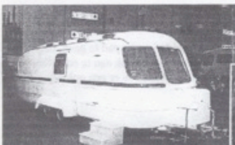
Voor zijn tijd, we schrijven 1969, was de Suleica Tandem een vooruitstrevend product, goed voor een lengte van 7.10 m en een gewicht van 1.250 kg.