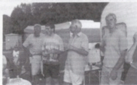
Tijdens het aperitief in Houyet op zondag 19 augustus 2001