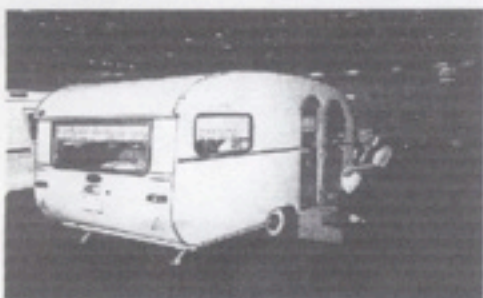
De Blessing uit 1968 is een voorloper van de Eura-Mobil. Hij werd in dezelfde fabriek te Spremdingen vervaardigd.