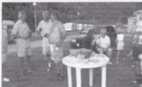
Druk in gesprek

We zochten samen naar een constructie die niet direct met de naam "bestuur" moest worden bestempeld.