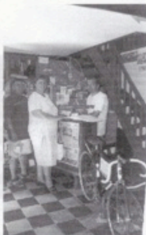
Bij de uitbater van het fietsmuseum