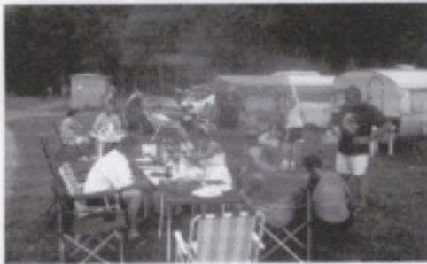
Wachten op vuur

Deze berichten worden stevast doorgestuurd naar Jos en Patrick om zo in één van de volgende clubblaadjes te laten verschijnen.