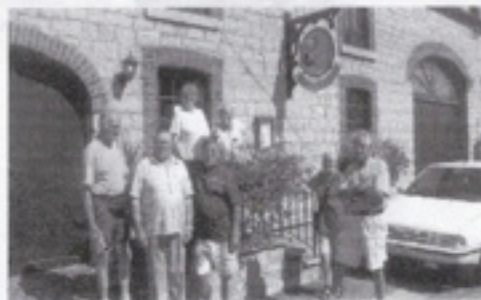
Het museum ter ere van de wielerkampioenen