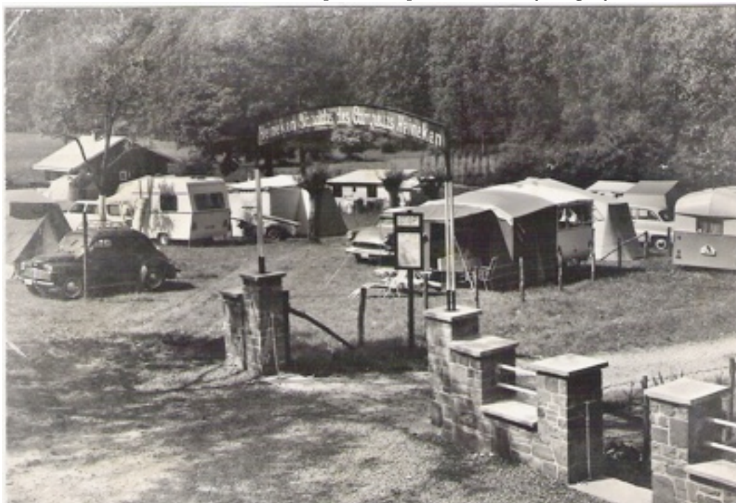
Kaart nr. 10 - Han Remouchamps "A l'air pur" vermoedelijk begin jaren 60

Het moet heerlijk geweest zijn om met je caravan door dit poortje te rijden en zo in het