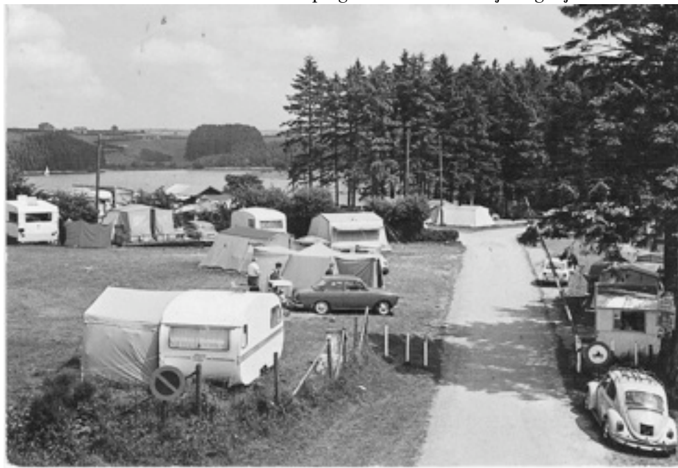
Kaart nr. 9 - Butchenbach "Camping et lac" vermoedelijk begin jaren 70

Geen enkele caravan op deze kaart is mij bekend.