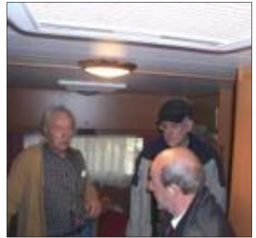
Drie reporters tegelijk te woord staan is hem wel toevertrouwd (de derde maakt de foto). Let eens op het speciale schuifdak; een vinding van de bouwer!