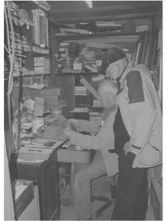
Samen foto's zoeken in het "archief"