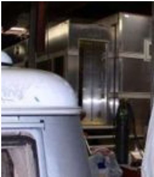
Nieuwe producten staan naast reparatiewerken in de werkplaats