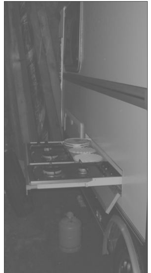
Onder: Ook een eigen vinding is het uitschuifbaar gasfornuis aan de buitenwand van de caravan.