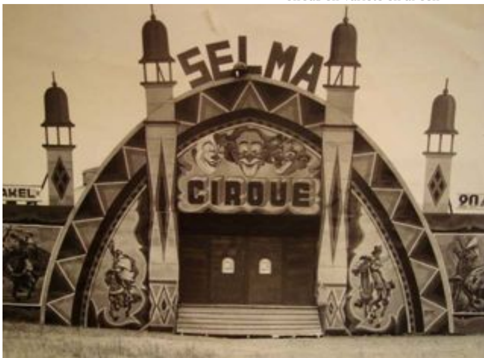
De ingang van het circus Selma in de jaren '30

Ondertussen had Leonard ook zijn intrede in het circus gedaan en was met een nichtje (dochter van Selma) van beide broers getrouwd. Zijn vrouw deed in het circus een act als slangenmens. Leonard zelf deed de trapeze. In de jaren vijftig was er een Amerikaanse onderneming die rodeoshow's gaf in Europa. Maar het liep niet echt en de zaak ging failliet. De paarden werden verkocht en Verswijvel kocht er een; "Wat waren die goed getraind" zegt hij; "het was een genot om ermee op te treden". In de zestiger jaren ging het niet zo geweldig met de circussen en vele legden dan ook het loodje. Artiesten kregen rechtstreeks opdrachten van televisiestations en konden een goede boterham verdienen buiten het circus. In het begin van de jaren '60 was er door de opkomst van televisie relatief weinig werk, en dus ook de mogelijkheid om hun mobiele