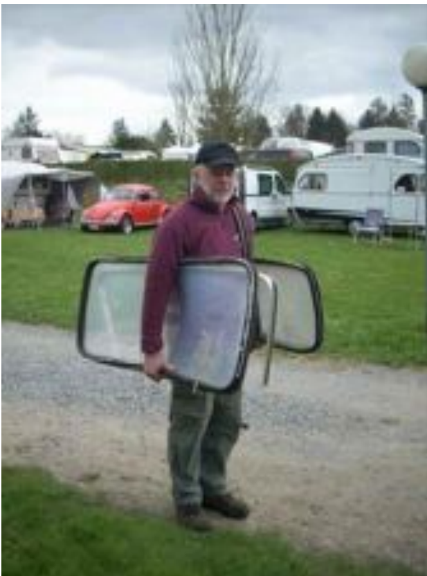
En de ODB sleepte met caravanstukken....

Toen de nodige flessen, pralines en bloemenbossen waren overhandigd en schouderklopjes uitgedeeld, kon de feestavond pas echt beginnen waarbij de beentjes van de vloer gingen en de