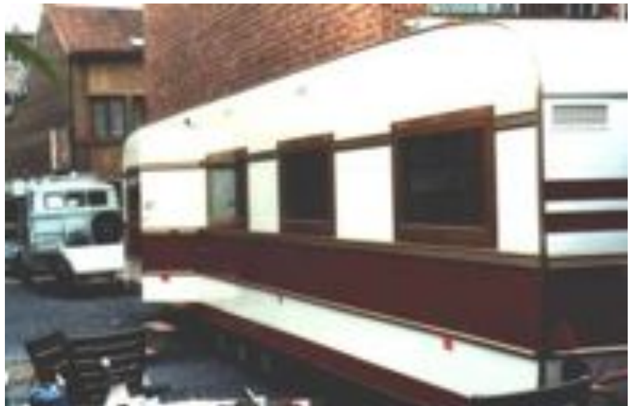
Boven een grote 3-assige Tembo-caravan. Onder: een 1-asser bijna even groot

In de laatste periode maken de heren foorwagens met uitschuifbare wanden. Anders dan de concurrentie, hebben zij een methode bedacht waarbij de