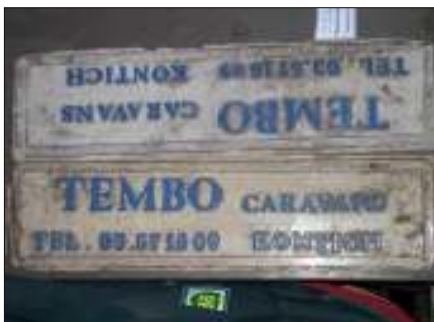
Links: Nogal wat veranderingen van logo's passeerden door de tijd. Maar de naam bleef, tot op de dag van vandaag