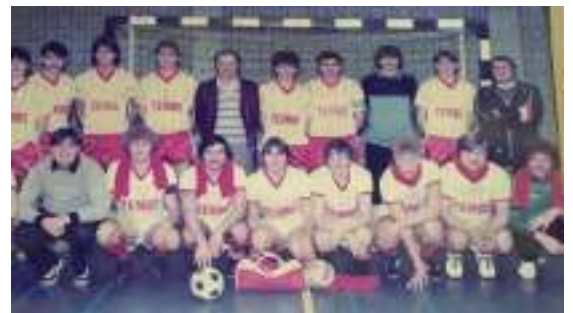
Rechts: Tembo was in die tijd zo bekend dat het een eigen (zaal-) voetbalclub er op na kon houden. We houden het maar op sponsoring